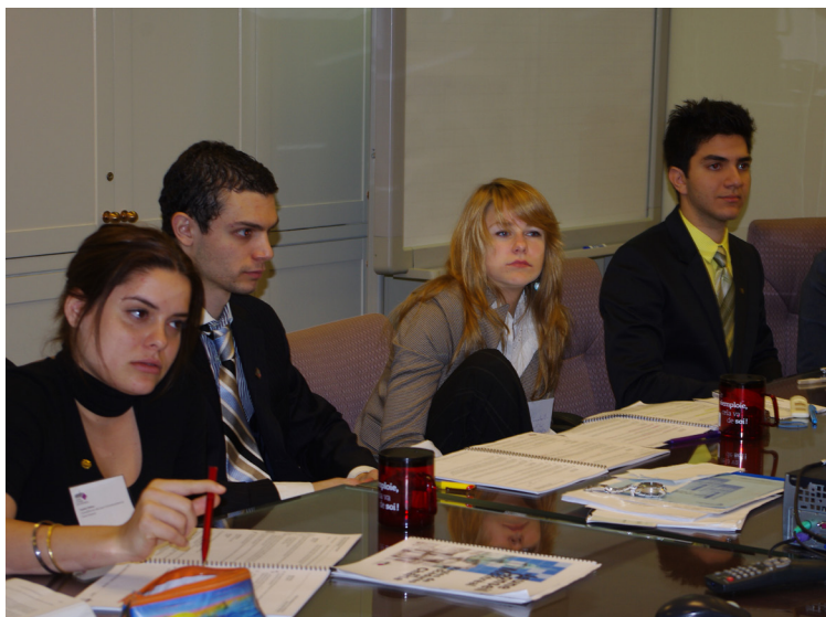
La commission sur les maisons de tolérance a traité du sujet avec une aisance impressionnante.

La commission a donc énormément servi à l'avancement, à la concrétisation et, disons-le, à la cohérence du projet qui, présenté sous vos yeux, contient beaucoup plus de « jus » pour les assoiffés de débat. Lorsqu'une telle bataille est engagée, il faut s'assurer que les causes en valent la peine et, surtout, que l'on s'attaque au bon adversaire. Heureusement, en cours de route, le projet de règlement s'est finalement consacré au bon combat : celui de la sécurité non pas — seulement — des clients, mais